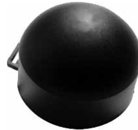
Matje pasive të radonit me dedektor CR-39

Matjet e Rn^{222} u kryen si matje pasive për një periudhë 3-mujore në sezone të ndryshme gjatë vitit shkollor.